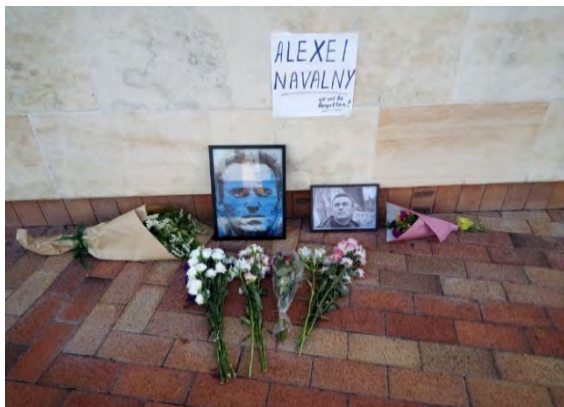
Civic Square, Веллингтон