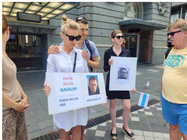
На митинге памяти Алексея Навального, Окленд, Новая Зеландия, 17 февраля

Абсолютное зло будет наказано. А героям – вечная слава.