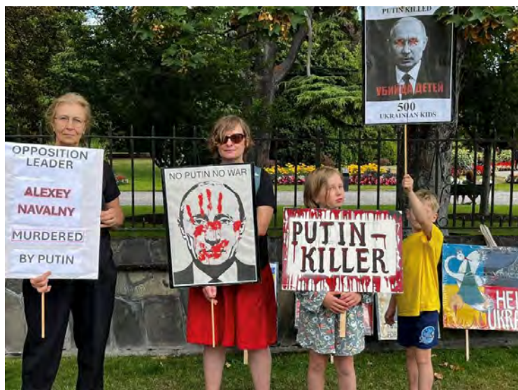
Акция в Крайстчерче, Новая Зеландия, 17 февраля