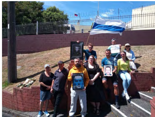
Веллингтон, акция у российского посольства, 17 февраля